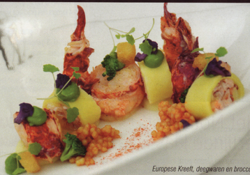
Europese Kreeft, deegwaren en broccoli

Bij ons bezoek aan de 5 restaurants, La Cravache, Het Oud Stadhuis, De vier Koningen, 't Convent en Het Notariaat hebben de chefs ons elk een geheim receptje verklapt. Uit elk van hun menu's hebben we een receptje gepikt en stelden zo een topdiner samen. Het zal je zeker inspireren voor een toekomstig diner met vrienden of familie.